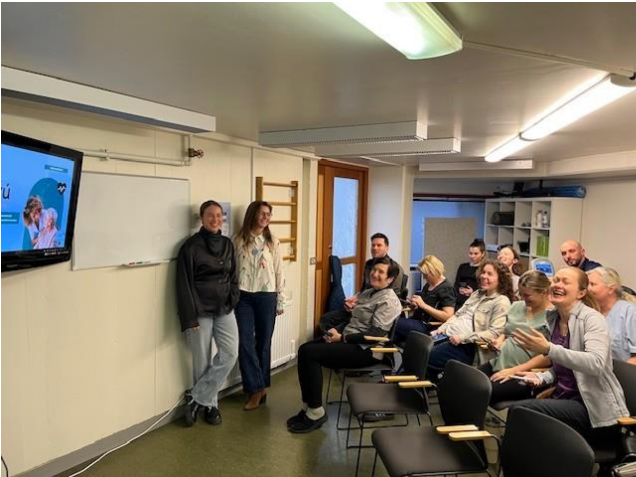
Mynd frá kynningu á prófunardeild Málbrúar á Hjallatúni.

Upphaf prófunarfasa einkenndist að einhverju leyti af tæknilegum áskorunum, einkum varðandi aðgengi að stöðuprófum í appinu. Slíkt hafði áhrif á fyrstu framkvæmd verkefnisins og tók tíma að tryggja að allir væru komnir inn í kerfið og gætu hafið notkun með eðlilegum hætti. Þessi reynsla hefur þó nýst vel til að varpa ljósi á hvaða þætti þarf að skýra betur og styrkja við áframhald verkefnisins.